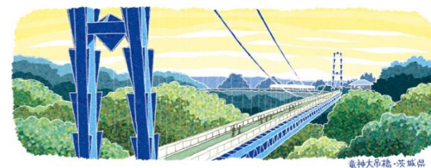
竜神大吊橋-茨城県

長さ375mの竜神大吊橋は、歩行者専用の橋としては本州一の長さを誇ります。橋の高さ(100m)から、日本で最も高いブリッジバンジージャンプの場としても有名。かつてIT企業のテレビコマーシャルに登場したことで一気に注目を集め、毎年なんと1万人以上がバンジージャンプを楽しみに訪れる人気スポットになっています。