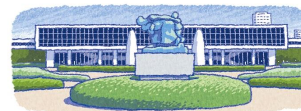
広島平和記念資料館・広島県

私も2年前に訪れましたが、人の生命というものを否が応でも考えさせられる場所だと強く感じました。